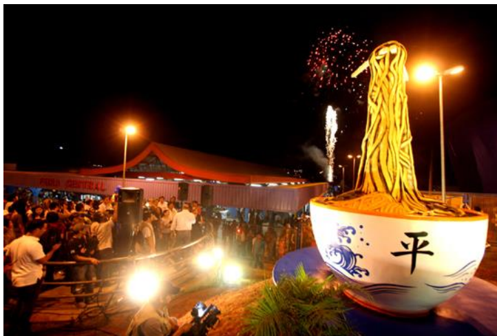
Feira Central

Feira Central (Feirona) , um dos programas mais tradicionais dos campo-grandenses não só para os finais de semana, pois a feira abre de quarta a domingo. Também conhecida como feirona é um daqueles lugares que dá água na boca só de pensar.